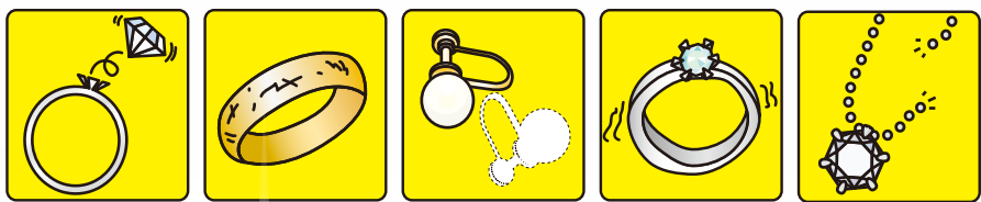
石がはずれた キズだらけ 片方だけのイヤリング 指輪が変形した 切れてしまったネックレス

もう着けない、サイズが合わなくなった指輪、切れてしまったネックレス、片方だけのイヤリング、記念品にもらった金杯、金の色が変わってしまったもの、キズがついていても、壊れてしまっても査定には影響ありません。